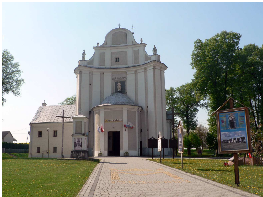
Fot. 1. Sanktuarium Niepokalanej Matki Dobrej Nadziei w Tuligłowach

Sanktuarium Niepokalanej Matki Dobrej Nadziei w Tuligłowach jest jednym z ponad 550 sanktuariów Matki Bożej funkcjonujących obecnie w Polsce (fot. 1). Jest także jednym z najstarszych i ważniejszych maryjnych ośrodków pielgrzymkowych w archidiecezji przemyskiej. Kult cudownego obrazu Matki Bożej Tuligłowskiej sięga początkami XIV w. W 1745 r. biskup przemyski Wacław Hieronim Sierakowski ogłosił wizerunek jako łaskami słynący. W dniu 8 września 1909 r. – za zgodą Kapituły Watykańskiej – łaskami słynący obraz Pani Tuligłowskiej został ozdobiony papieskimi koronami przez ks. biskupa Józefa Sebastiana Pelczara. Obecnie do sanktuarium w Tuligłowach przybywają nie tylko pielgrzymi z archidiecezji przemyskiej, ale także pątnicy z odległych zakątków Polski, aby w chwilach trudnych szukać pocieszenia przed cudownym obrazem Matki Bożej Niepokalanej.